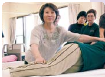
生活支援技術指導の様子