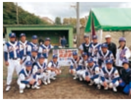
ソフトボール 本荘愛球会