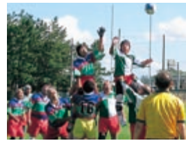
ラグビー 秋田不惑ラグビークラブ