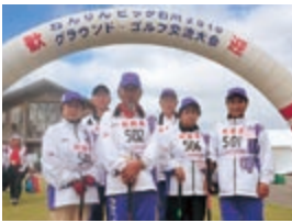
グラウンドゴルフチーム