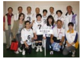
ソフトバレーボール 能代愛好会