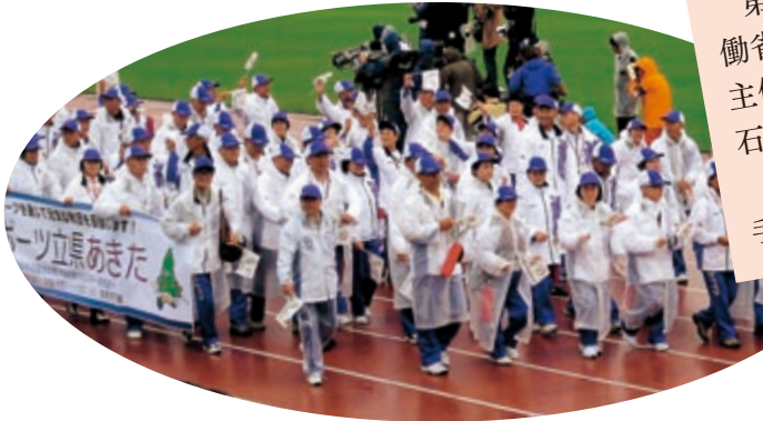
総合開会式で入場行進する秋田県選手団

第23回全国健康福祉祭いしかわ大会が厚生労働省・石川県・財団法人長寿社会開発センターの主催で、平成22年10月9日から12日までの4日間、石川県内で開催されました。どの競技も熱戦健闘されたとともに、他県の選手・ボランティアの方々とふれあいました。