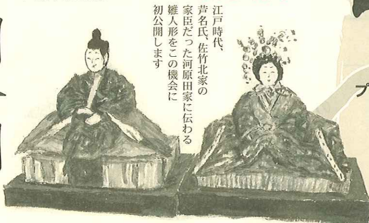
江戸時代、若名氏、佐竹北家の家臣だった河原田家に伝わる雛人形をこの機会に初公開します