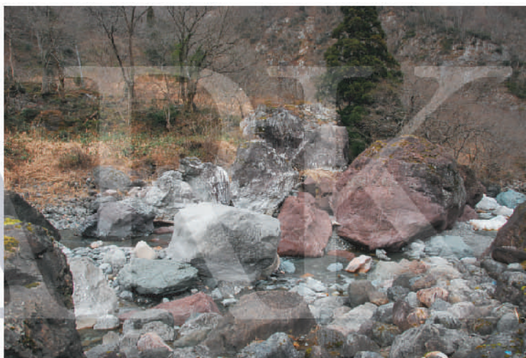
小滝ヒスイ峡(新潟県糸魚川市)

講演会では糸魚川で活動されているの方々をお招きしてお話をうかがい、男鹿市、潟上市、大潟村における、ジオパーク認定に向けた活動の方向、取り組み方などを探ります。