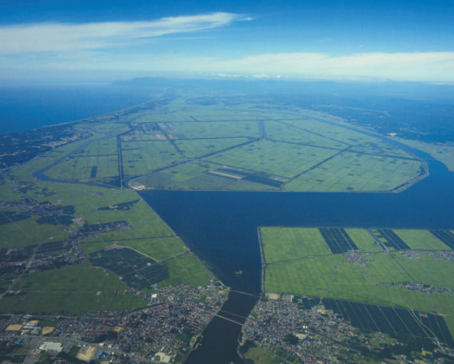
人工の大地・大潟村