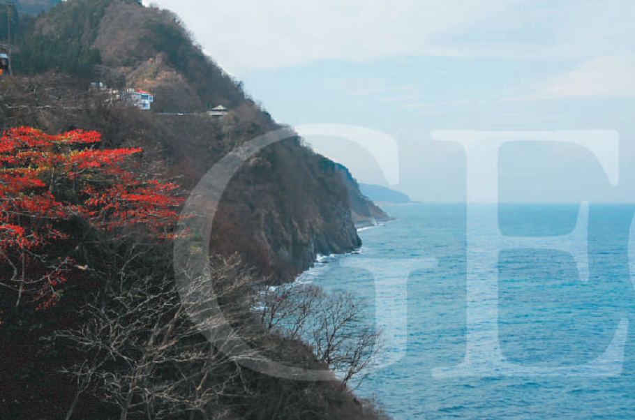
親不知海岸(新潟県糸魚川市)