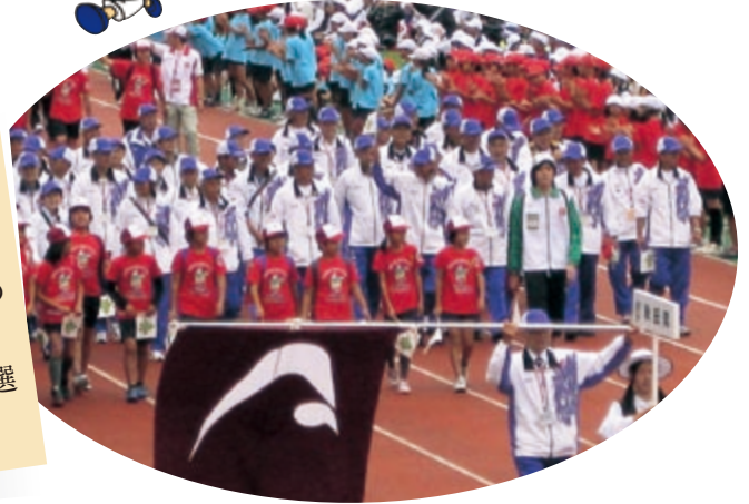
総合開会式の秋田県選手団

第24回全国健康福祉祭くまもと大会が厚生労働省・熊本県・一般財団法人長寿社会開発センターの主催で、平成23年10月15日から18日までの4日間、熊本県内で開催されました。どの競技も熱戦健闘されたとともに、他県の選手・ボランティアの方々ともふれあいました。