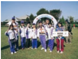
ウオークラリーチーム