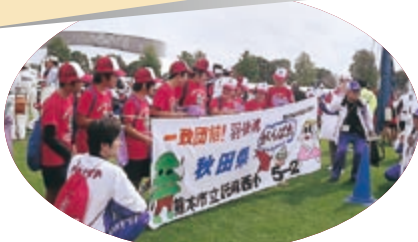
地元の小学生も応援にかけた