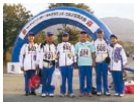
グラウンドゴルフチーム