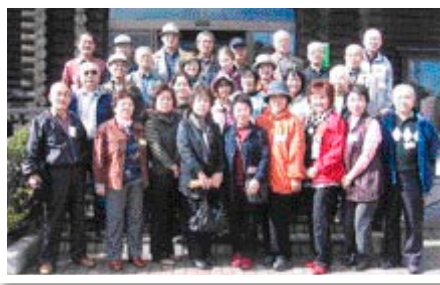
上の岱地熱発電所PR館 平成22年10月