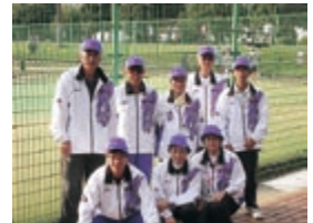
ソフトテニスチーム